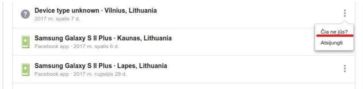
4 pav. Įrenginiai, kuriais buvo prisijungta prie jūsų paskyros